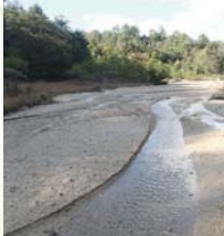
【堆積した砂】水がとてもきれいです。

天神川から支流を堂山方向へ、案内看板を頼りに約700mほど登ったところに、鎧堰堤があります。