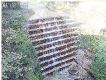
【鎧堰堤】さらさらと流れ落ちる水の音に癒されます。