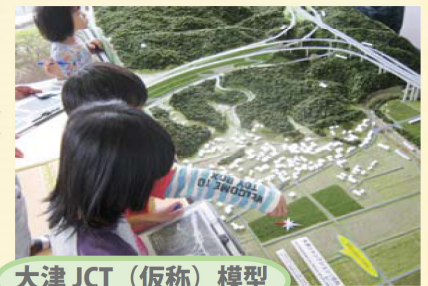
大津 JCT (仮称) 模型