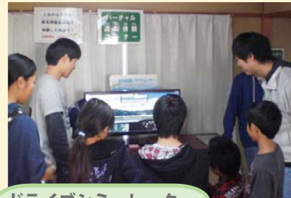
ドライブシミュレーター

当日の来場者は、約 200 名と大盛況であり、お子様と一緒にドライブシミュレーターや橋梁模型の体験学習を通じて、新名神事業の PR を行うことができました。