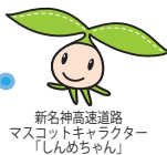
新名神高速道路 マスコットキャラクター 「しんめちゃん」