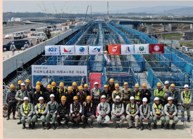
川田工業現場スタッフ及び協力業者の皆さん 〔株杉本工業所関係者、株オオタ、鉄電塗装(株)〕

今後は床版工事・足場解体工事を予定していますが、安全を最優先にして進めていきます。地域の皆様には、府道252号の通行止め等ご不便をおかけしますが、ご理解とご協力のほど、よろしくお願いいたします。