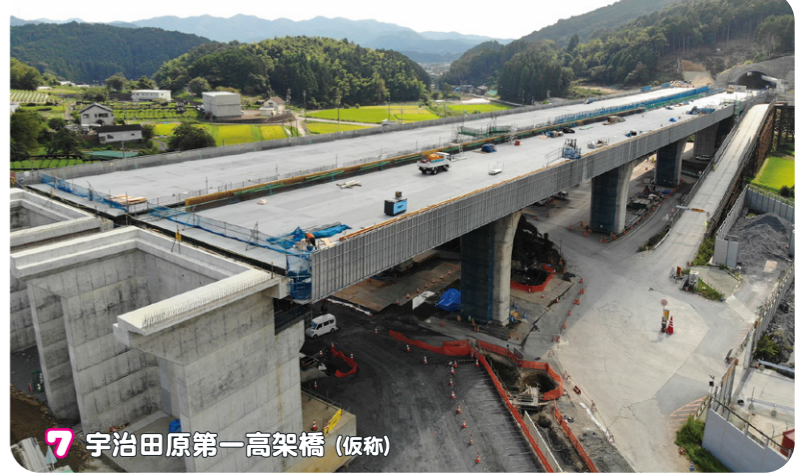
7 宇治田原第一高架橋 (仮称)