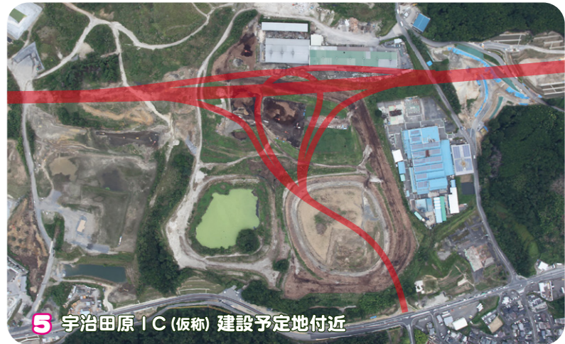
5 宇治田原 IC (仮称) 建設予定地付近