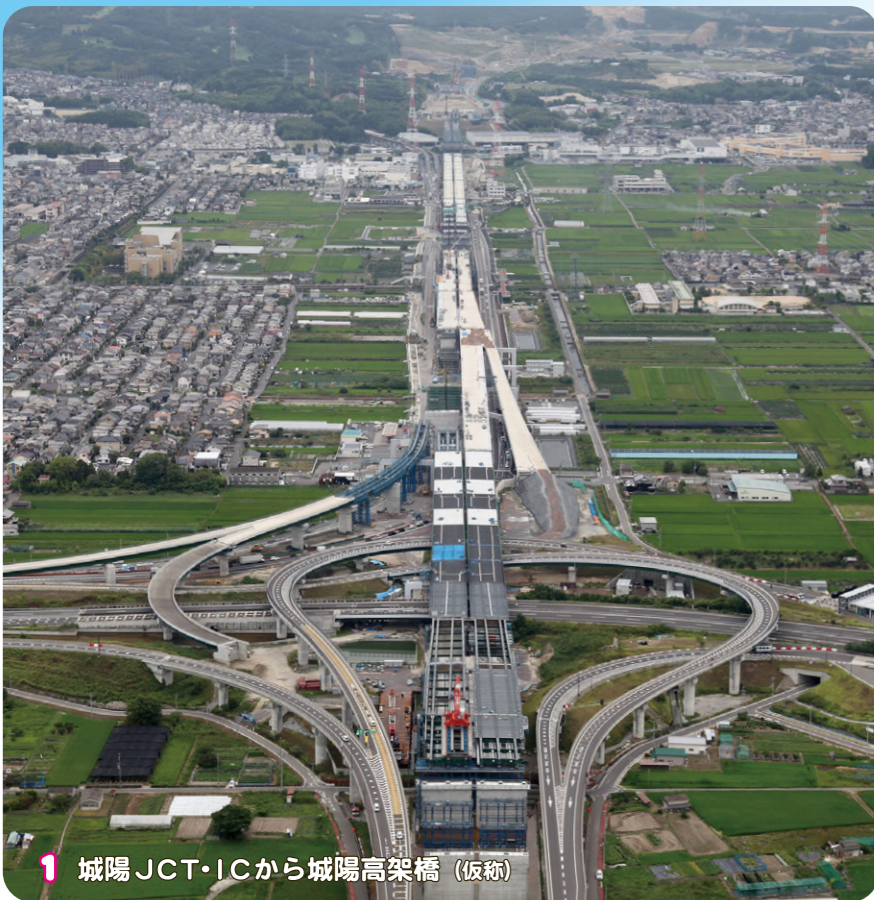
1 城陽 JCT・ICから城陽高架橋 (仮称)