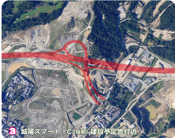
3 城陽スマート IC (仮称) 建設予定地付近

工事が完了した4車線断面を6車線断面にするため、上り線と下り線の拡幅工事をしています。近鉄上空かつ国道24号が隣接しており、高架下にクレーンを設置することができないため、橋面上にクレーン2台を設置し、相吊り架設を行いました。