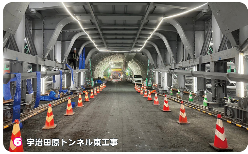
6 宇治田原トンネル東工事