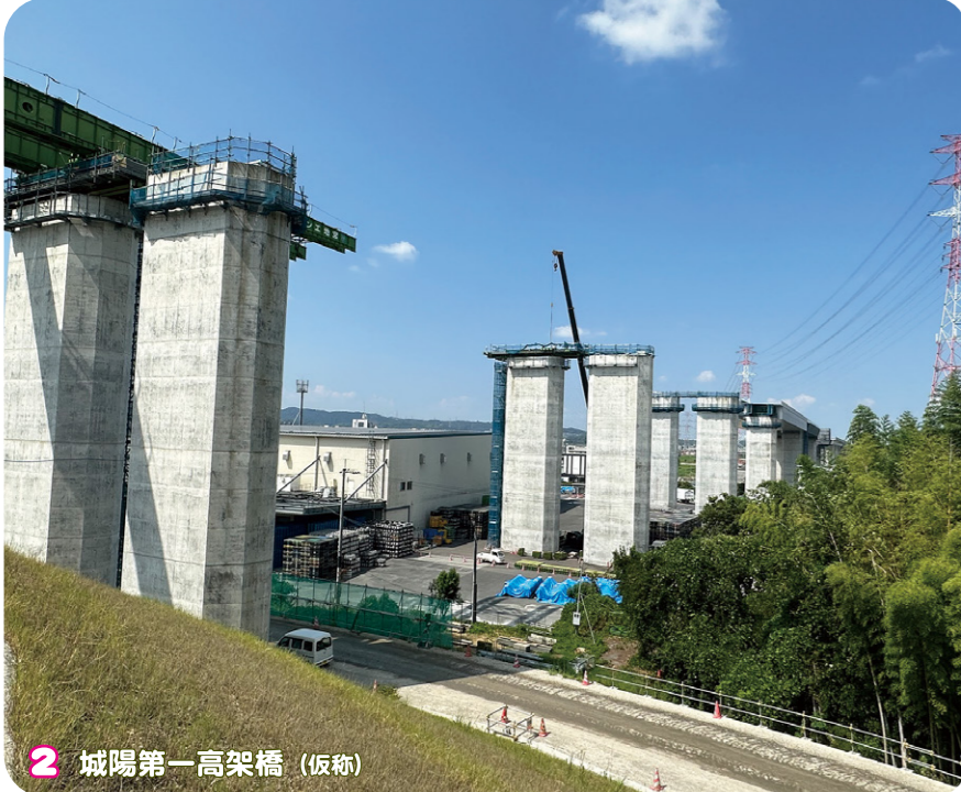
2 城陽第一高架橋 (仮称)