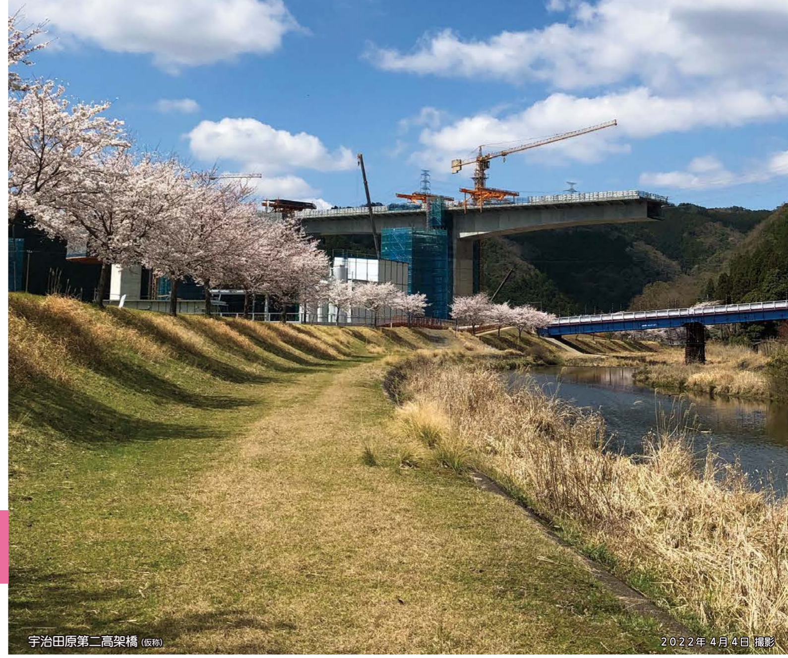
宇治田原第二高架橋(仮称)