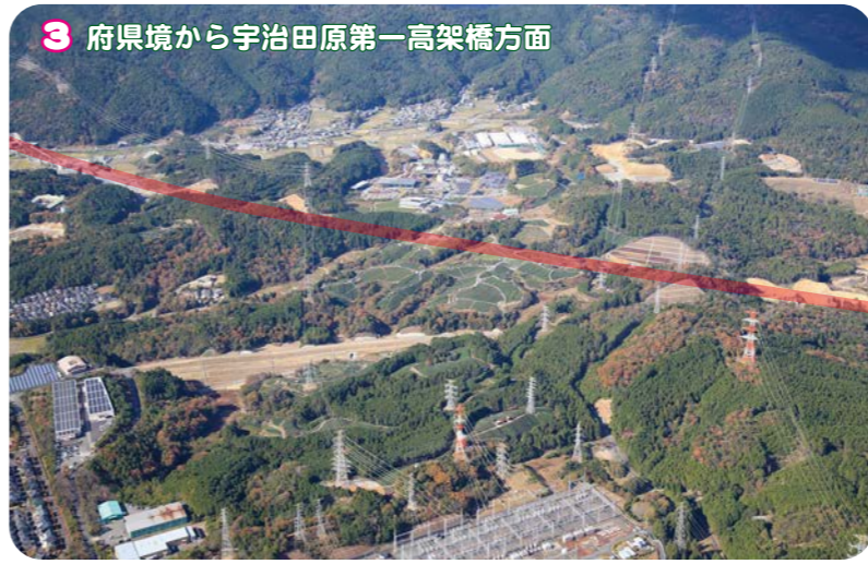
3 府県境から宇治田原第一高架橋方面