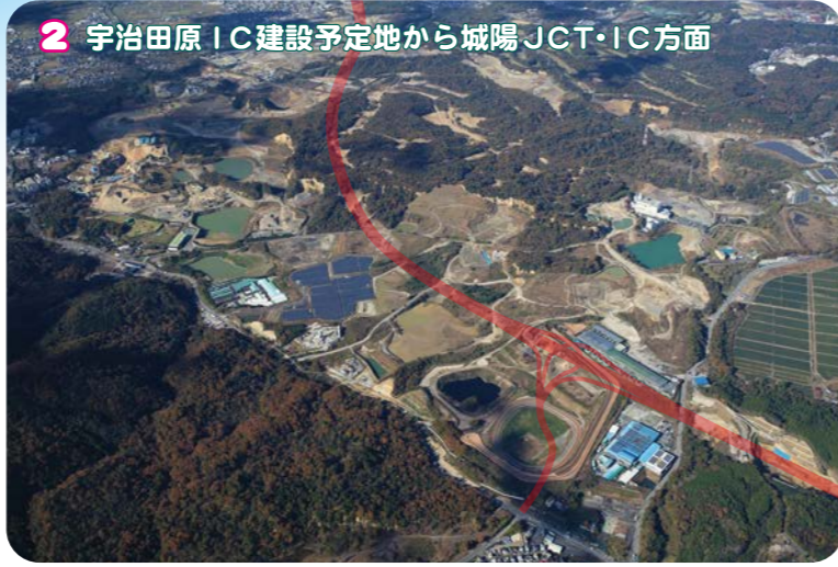
2 宇治田原IC建設予定地から城陽JCT・IC方面