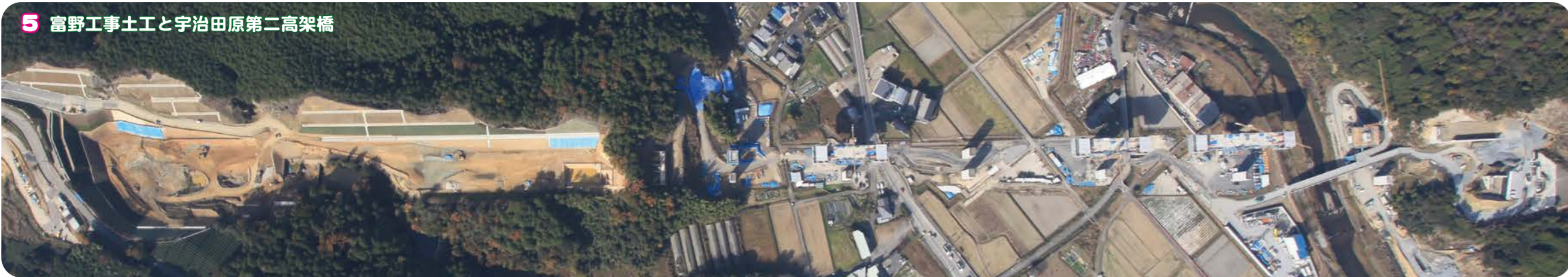
5 富野工事土工と宇治田原第二高架橋