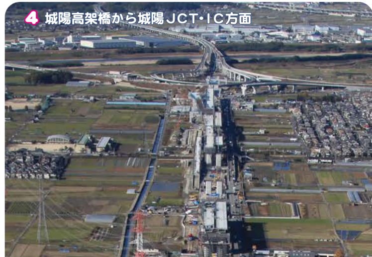
4 城陽高架橋から城陽JCT・IC方面