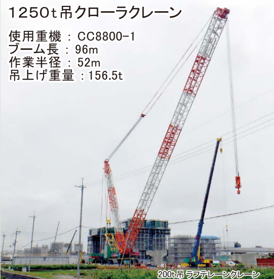
*クレーンの組み立てには10日間を要しました

使用重機: CC8800-1 ブーム長: 96m 作業半径: 52m 吊上げ重量: 156.5t