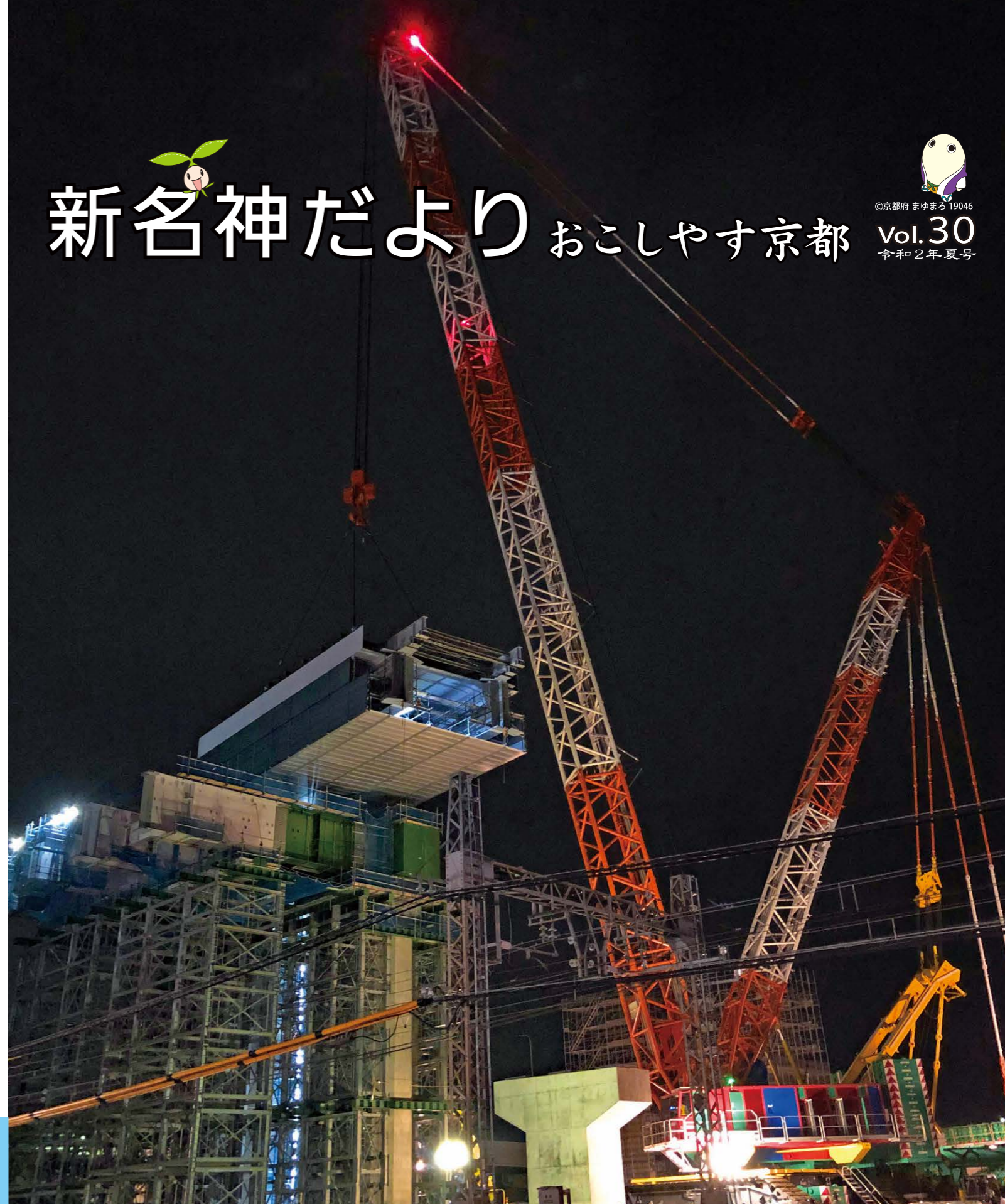
近鉄京都線を跨ぐ本線架設工事を夜間に行いました。 作業は近鉄電車の運行最終から始発までの間に、1250tクレーンを使って鋼桁を吊り上げ、架設を行いました。 2020年6月27日 未明

E1A新名神高速道路(路線名:近畿自動車道名古屋神戸線)は、名古屋市を起点として神戸市に至る174kmの高速道路です。E1名神高速道路、E2A中国自動車道など周辺の高速道路とともに、近畿圏と中部圏を結ぶネットワークを形成します。これにより高速道路に求められる[高速性][定時制][快適性][安全性]などの機能を高めるとともに、沿道及び西日本の広域医療・観光・文化交流など地域の経済・住民生活への貢献も期待されます。新名神京都事務所では、京都府域の16.4kmを担当しています。2017年4月開通の城陽JCT・ICから八幡京田辺JCT・IC間はそのうちの約3.5km。E24京奈和自動車道とE89第二京阪道路とが直結しました。また、2018年3月には高槻JCT・ICから神戸JCT間も開通。E1名神高速道路の交通量が分散し渋滞が大幅に減少しており、沿線市町村では物流施設や大規模小売店の立地・整備も進んでいます。今後も引き続き安全・安心第一に、残りの区間の工事を進めてまいります。