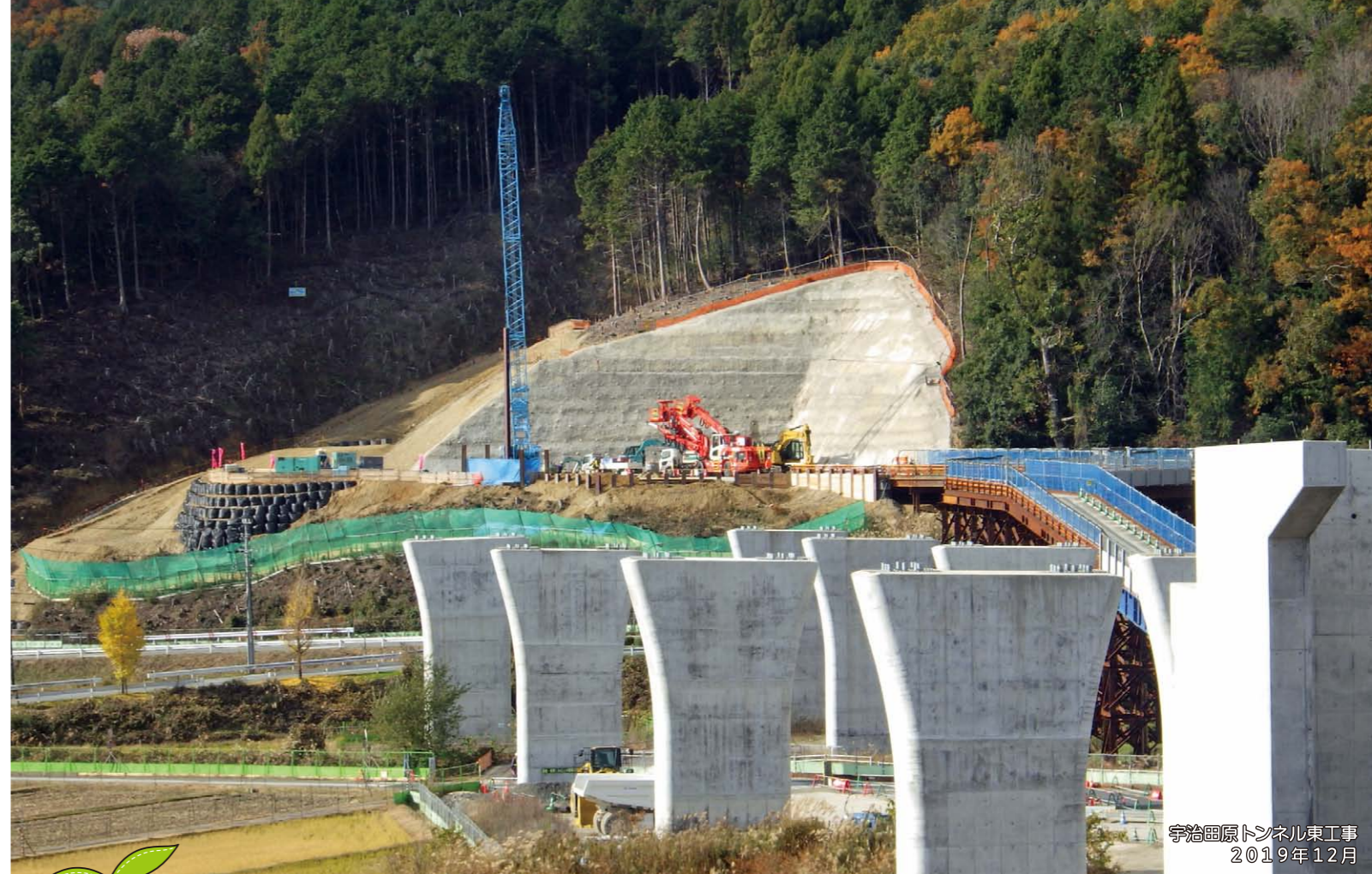
宇治田原トンネル東工事 2019年12月