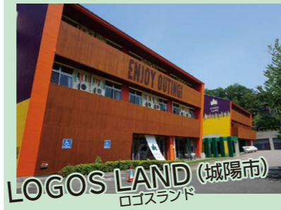
LOGOS LAND (城陽市) ログスランド

「城陽市総合運動公園」が総合アウトドアレジャー施設「LOGOS LAND (ログスランド)」としてリニューアルオープンします!