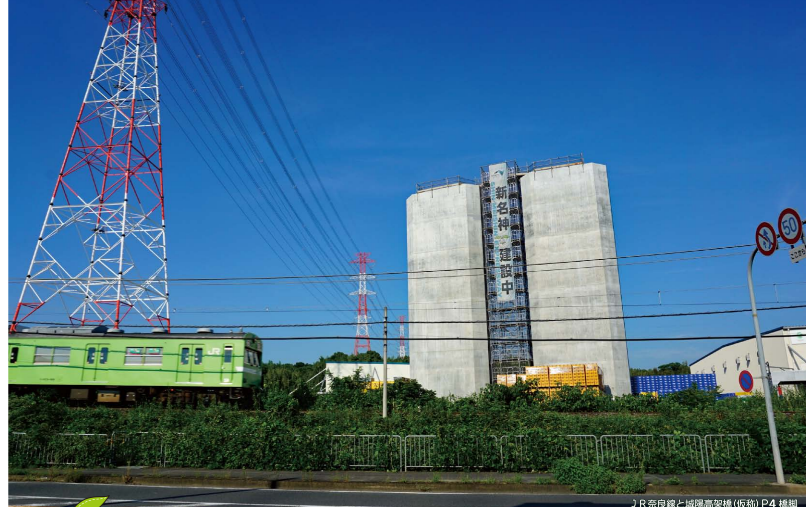
JR奈良線と城陽高架橋(仮称)P4橋脚

*城陽JCT・ICから車で約2分 *詳しくはJAやましろ城陽支店まで(土・日・月以外の9時~16時30分)