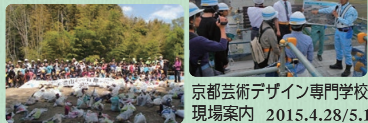
京都芸術デザイン専門学校 現場案内 2015.4.28/5.1