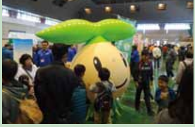
京田辺市 産業祭り 2013.11.17

各地域で行われたイベントにNEXCO西日本より当事務所が出展し、新名神高速道路建設事業のPR活動を行いました。文化パルク城陽にて行われた「JOYO産業まつり」では、雨にもかかわらずたくさんの方々にお越しいただき、事業説明パネル等をご覧いただきました。宇治田原町民グラウンドにて行われた「宇治田原商工祭」では、ステージイベントの椅子取りゲームでしんめちゃんも活躍し、とても賑やかに盛り上がっていました。京田辺市立田辺中央体育館にて行われた「京田辺市産業祭り」では多くのブースが出展され、しんめちゃんも地元の子もたちに囲まれて和やかな雰囲気でした。どの会場でも多くの方々にアンケートをお答えいただきました。ご協力ありがとうございました。これからも皆様のご期待にお応えできるよう開通に向けて安全第一に工事を進めてまいります。