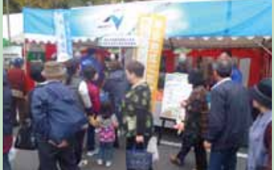
JOYO 産業まつり 2013.11.3