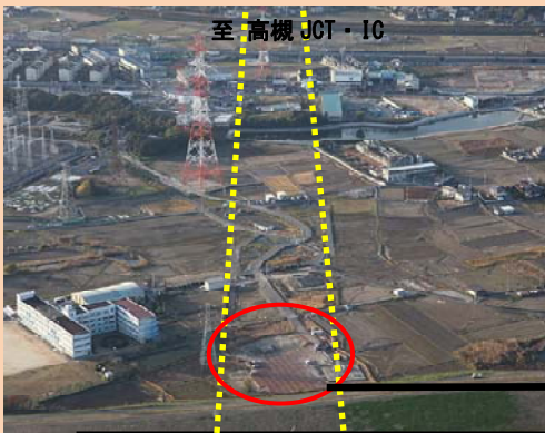
④用地取得や本線工事に向けた準備をしています。