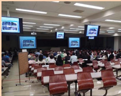
①美濃山西工事開始の地元説明会を開催しました。