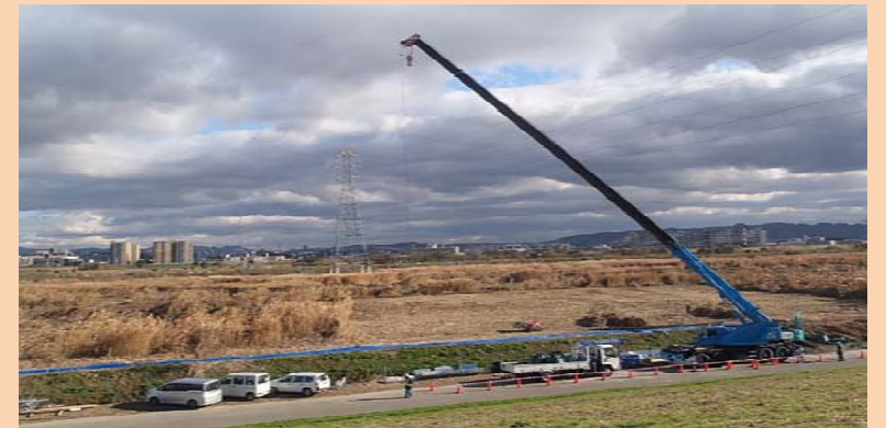
③淀川橋工事を開始しました。(高槻市側から撮影)