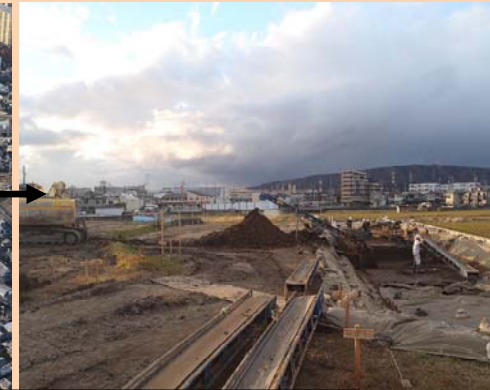
②用地取得や本線工事に向けた準備をしています。