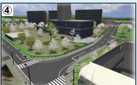
トンネル西坑口換気塔付近