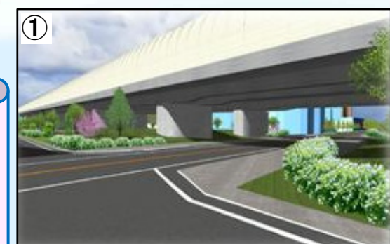
市道楠葉中宮線交差部

大都市間を結ぶネットワークは、災害や事故などの時にも機能するよう、多重化が必要です。新名神は名神と一体となり、ネットワークの多重化を形成します。