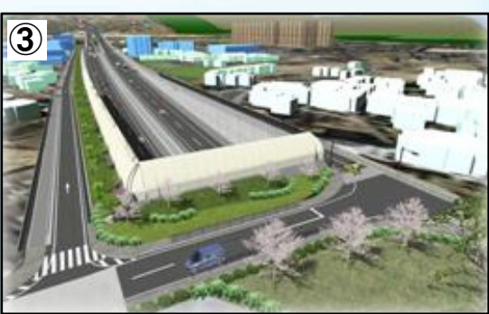
トンネル西坑口付近