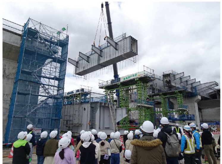
令和6年3月7日（木）に近隣小学校の児童を対象とした淀川東高築橋（鋼上部工）工事の現場見学会を開催しました。