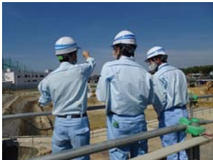
新名神大阪東事務所での夏季実習の様子

新名神大阪東事務所・新名神大阪西事務所では 8 月～9 月にかけて計 6 名の夏季実習生の受け入れを行いました。