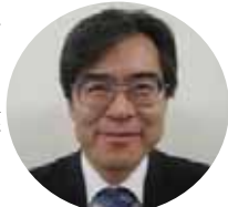
ツイキ 築城副所長

皆様方のご希望にすべて応えることは難しいところもありますが、NEXCO・公社共々誠意をもって話し合いをさせて頂くつもりですので宜しくお願いします。