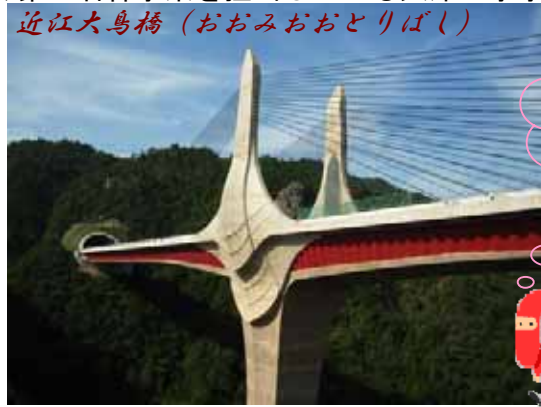
近江大鳥橋（おおみおとりばし）

『しっかりとしたものを、より早く、より安く』を目標に事務所一丸となって頑張っております。何卒ご理解とご協力を賜りますようお願いいたします。