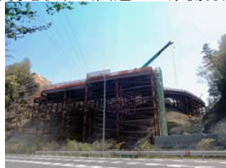
①現地状況（国道173東側付近）