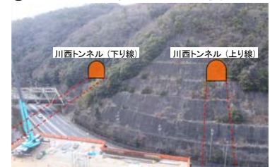
②現地状況（国道173西側付近）