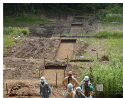
【試掘調査状況(茨木市千提寺)】

茨木北インターチェンジ周辺では、埋蔵文化財の試掘調査を実施しています。インターチェンジ周辺には、調査箇所が複数点在していることから工事との調整を行いながら実施しています。