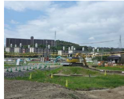
【現場状況(高槻市成合)】

高槻ジャンクション周辺では、高速道路本体工事着手に必要な埋蔵文化財調査、仮囲い及び工事進入路の設置を行っています。ご迷惑をおかけしますが、ご協力のほどよろしくお願い致します。