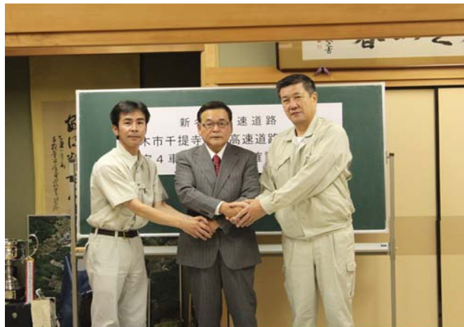
【設計協議書調印式(茨木市千提寺)】

平成23年7月5日(火)に、茨木市千提寺地区との暫定4車線施工協議確認書の調印式が執り行われました。関係地区のみならず、お忙しい中、設計協議にご理解とご尽力いただきまして誠にありがとうございました。引き続き、必要な部分を協議させていただきながら新名神事業を進めてまいりたいと思います。今後ともご理解とご協力よろしくお願い致します。