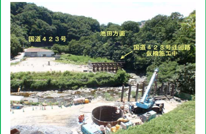
【高速道路 橋梁基礎施工中(箕面市止々呂美)】

箕面市止々呂美地区において、7月に暫定4車線施工協議確認書を締結させて頂き、高速道路橋梁下部工工事に着手致しました。止々呂美地区の皆さまにおかれましては、協議にご理解とご尽力頂きまして誠にありがとうございました。また、インターチェンジが接続する国道423号の改良に際して必要となる迂回路について、大阪府と協力しながら工事を進めています。