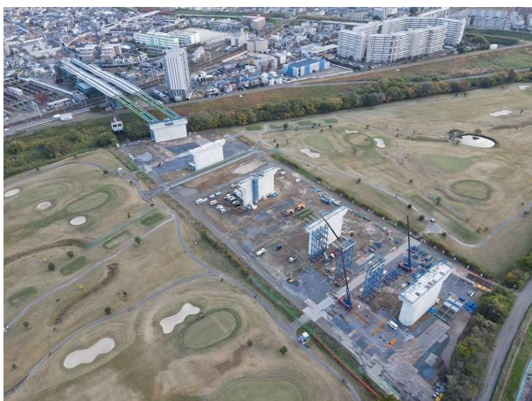
⑤ 橋梁上部工を架設するためのベントの組立を行っております。