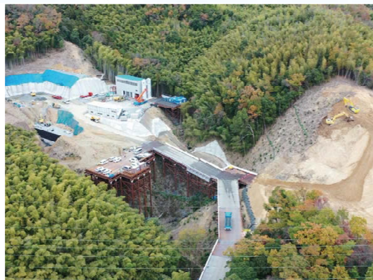
② トンネル掘削に向けた仮設備の設置・地山の切土掘削を行っております。