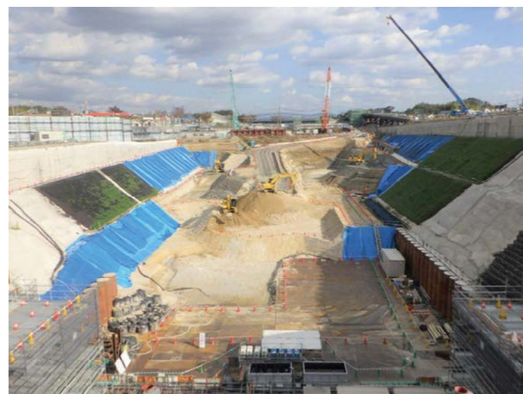
⑦ 掘割区間の掘削および法面の施工を行っております。