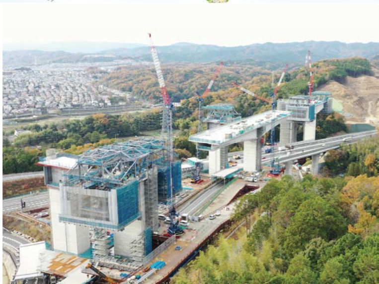
① 橋梁上部工の張出架設を行っております。