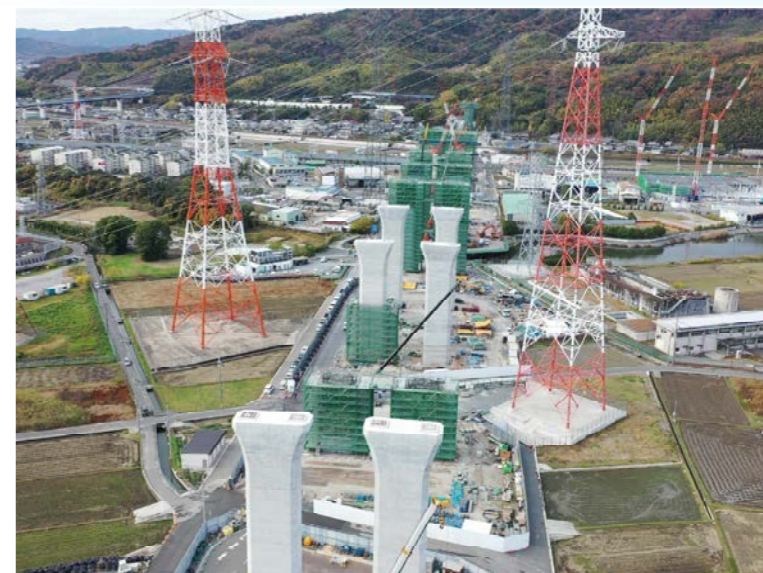
④ 橋脚が8基ほど立ち上がってきました。今後も下部工の施工を進めてまいります。