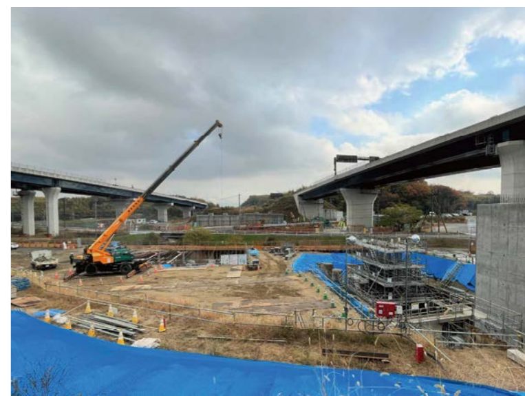
⑧ 橋梁下部工の施工を行っております。