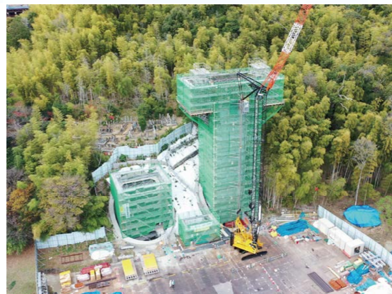
③ 橋梁下部工の施工を行っております。