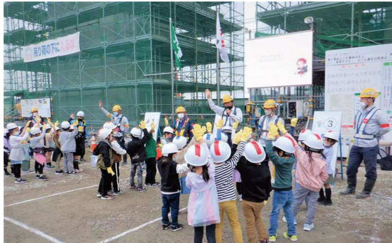
11月21日(月)に五領小学校の1年生約50名・11月22日(火)に上牧小学校の1年生約40名に対して、高槻高架橋東(下部工)工事の現場見学会を開催いたしました。小学生の皆さんは建設現場に興味津々な様子で「とても楽しかった」という声を多数いただきました。