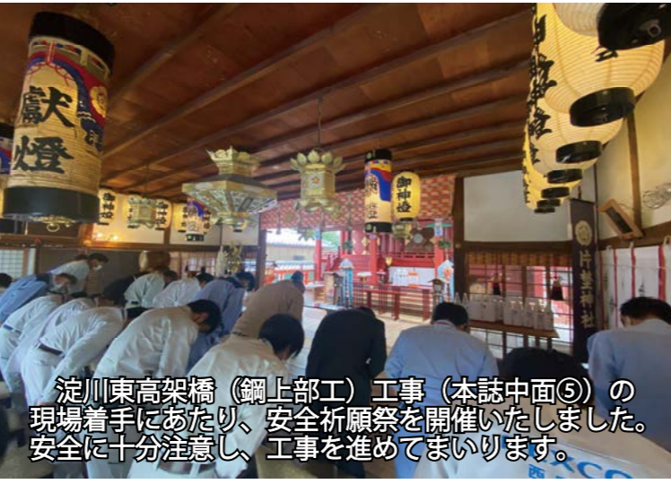
淀川東高架橋(鋼上部工)工事(本誌中面⑤)の現場着手にあたり、安全祈願祭を開催いたしました。安全に十分注意し、工事を進めてまいります。