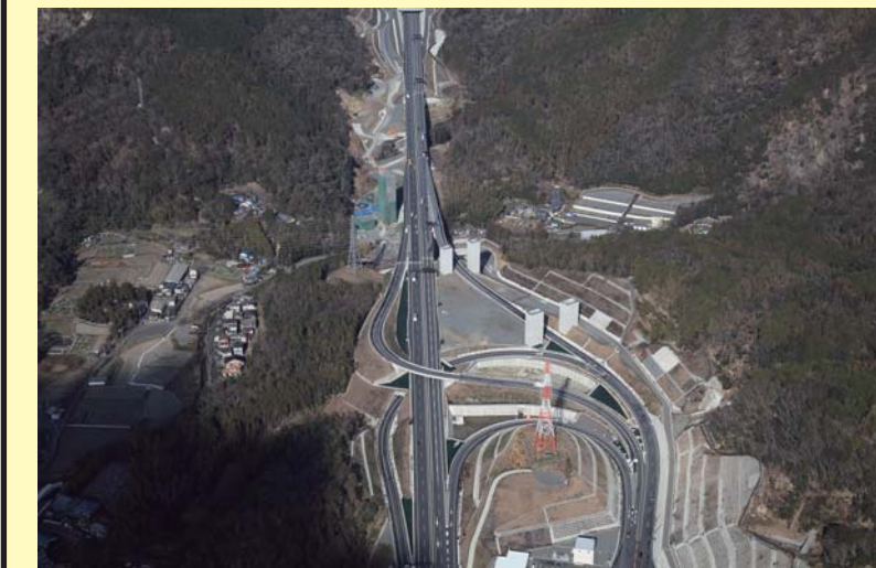
成合第一高架橋工事