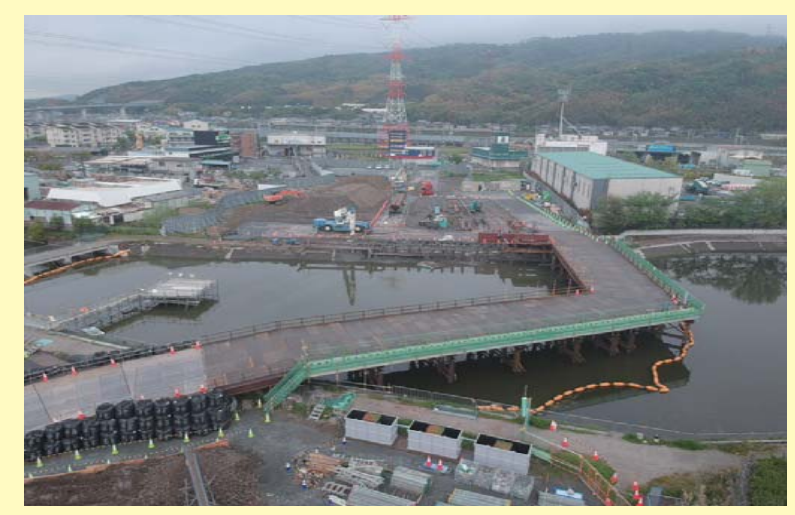
高槻高架橋東(下部工)工事