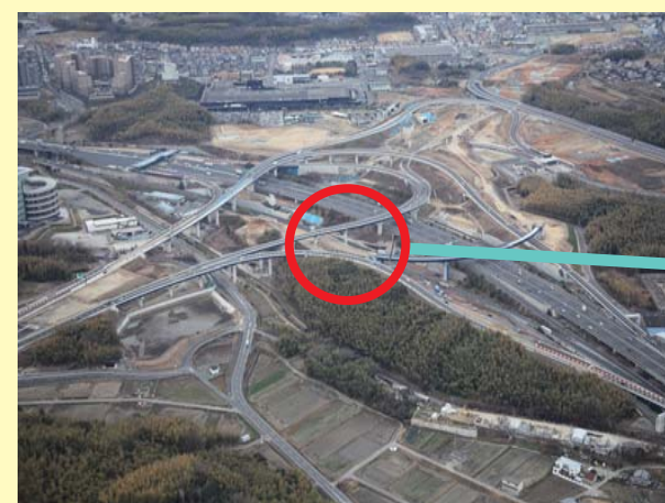
八幡JCTBランプ1号橋他4橋(鋼上部工)工事/美濃山東工事