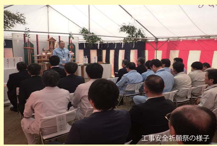
工事安全祈願祭の様子