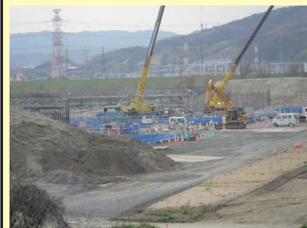
淀川東高架橋(下部工)工事