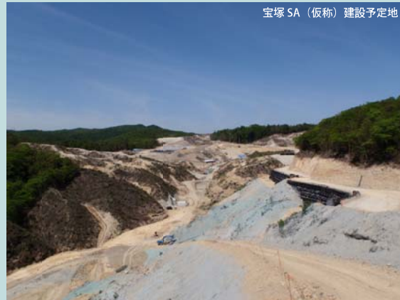
宝塚SA(仮称)建設予定地

宝塚SA(仮称)建設予定地の造成状況写真です。現在、神戸市域の工事で発生した土を有効利用して盛土工事を行っています。今秋には、川西市・猪名川町域からの土の受け入れも開始予定です。