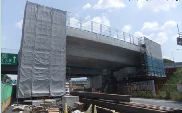
神戸ジャンクション Hランプ橋

神戸ジャンクションにおいて、中国道との交差部分の工事を行うために中国道の下り線を一時的に迂回路へ切り替えて工事を行っています。写真は、中国道下り線を跨ぐランプ橋です。今秋には中国道行きの上り線の車線運用を切り替える予定にしています。