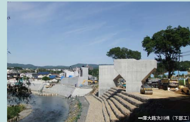
一庫大路次川橋(下部工)

川西市の西畦野地区と石道地区の間に位置するインターチェンジを造成する工事です。写真右側の橋脚2基が新名神の橋脚です。写真奥側の橋台は兵庫県で建設中の川西インター線の橋台です。