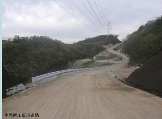
生野西工事用道路

生野西工事用道路が平成25年5月に完成しました。高速道路の工事を行うための一般道路から本線工事現場までへの取付道路であり、この道路を使って神戸市域から発生する土を宝塚市域に運搬する予定です。