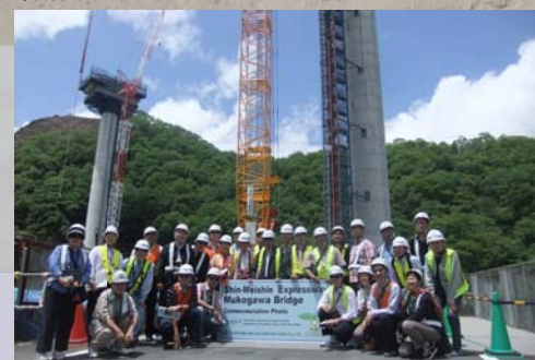
H25.5.20 武庫川橋建設現場にて

当日は新名神建設事業の概要説明後に、神戸ジャンクション工事と武庫川橋工事の現場で採用している技術等について紹介をさせて頂きました。