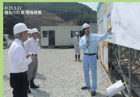
H25.5.22 猪名川町長 現場視察