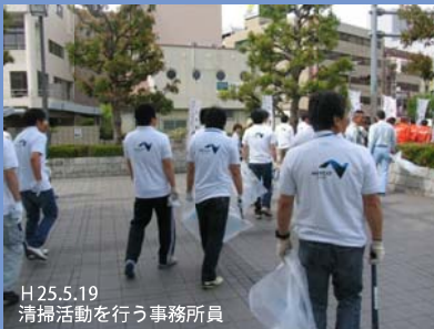
H25.5.19 清掃活動を行う事務所員