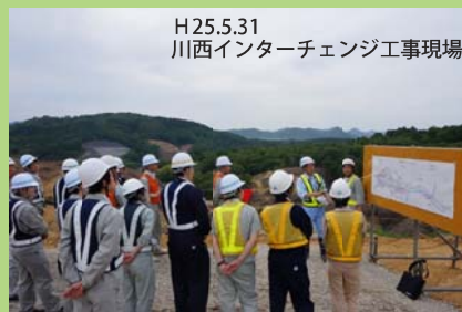
H25.5.31 川西インターチェンジ工事現場

当事務所が担当する建設現場は、これからも橋梁工事やトンネル工事が行われますので、若手技術者の育成、技術の伝承に取り組めます。