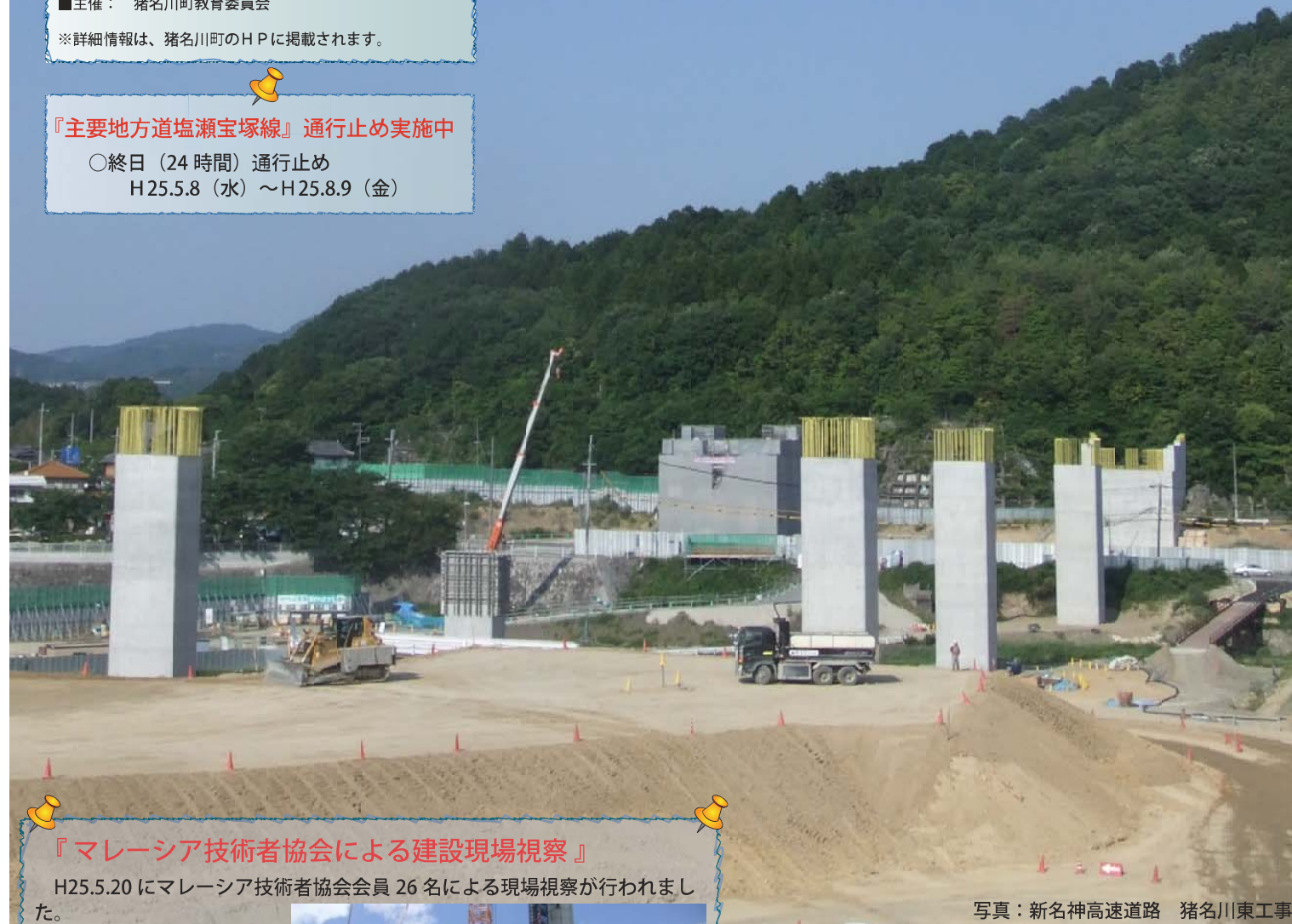
写真：新名神高速道路 猪名川東工事