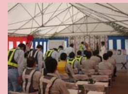
H24.10.3 川西トンネル工事安全祈願祭