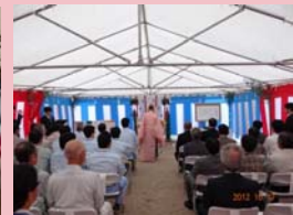
H24.10.17 道場生野工事安全祈願祭