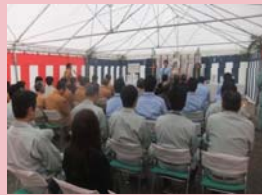
H24.11.27 猪名川西工事安全祈願祭