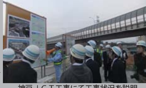
神戸JCT工事で工事状況を説明

当日は9社の報道関係者の方々にご参加を頂き、兵庫県域における新名神高速道路の建設状況として川下川橋、宝塚SA（仮称）、武庫川橋、神戸JCTをご案内しました。