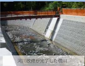
河川改修が完了した僧川

(森) この工事では盛土工事において情報化施工という新しい現場管理方法を採用いたします。これは作業場所の様子を事務所にて進捗具合や品質の管理が把握できるというものです。 具体的にはインターネット回線を現場内に張り巡らし、WEBカメラで現場の様子を確認したり、GPS装置を搭載したブルドーザや転圧ローラで現在の仕事をしている位置や高度、またどのくらい締め固めできたかを事務所管理できるような仕組みです。 事務所と作業場所は2km以上離れており、仕事の範囲も32,000㎡と広大ですが、この方法により一箇所で集中管理と詳細管理が同時にできるようになります。 さらに作業箇所の気象観測その他のさまざまなデータの集中管理や、職員間の通信システムも広範囲に管理しております。 これからは広域な施工範囲を管理していくこととなりますが、無事故、無災害で工事を進めることがこの工事に携わる者の使命と考え、職員、作業員全員が気持ち合わせて努力して参ります。 今後も、多方面の方々のご指導、ご鞭撻をいただきたく願っておりますので、どうぞよろしくお願いいたします。