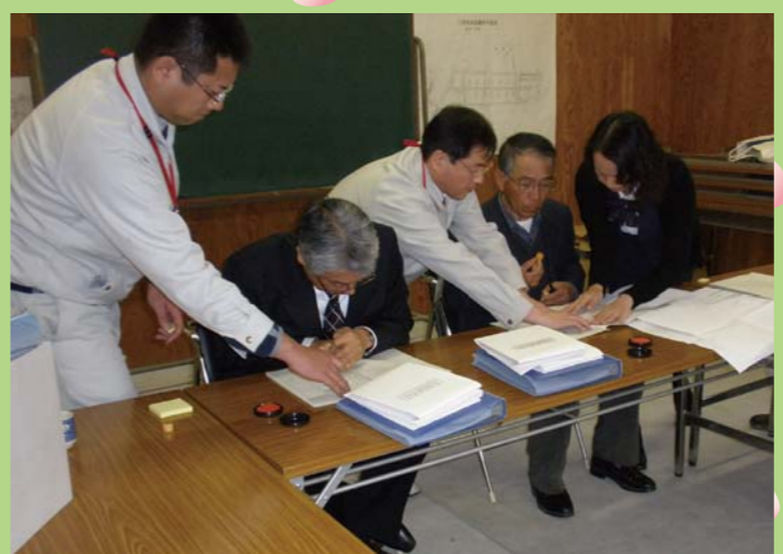
H22.3.25 神戸市北区有野町東二郎下自治会 暫定4車線設計協議調印式 この度、神戸市北区有野町東二郎下自治会におきまして、暫定4車線設計協議の調印式を行うことが出来ました。塗師会長様ご協力ありがとうございました。

NEXCO 西日本 お客さまセンター (7-1コール) 0120-924863 (クルマでおでかけ 24時間ハローさん) ※フリーコールがご利用できないお客様は、 06-6876-9031 (通話有料) (年中無休・24時間)