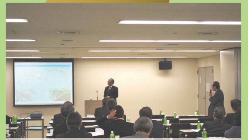
H22.2.9 宝塚商工会議所新名神事業説明 新名神の意義を広く社会に伝え、事業のよき理解者、よき支援者となって頂くよう、沿線の商工会議所や商工会の会議の場、また企業へ赴き、新名神の事業説明を行っています。