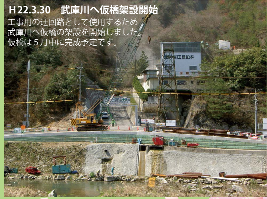
H22.3.30 武庫川へ仮橋架設開始 工事用の迂回路として使用するため、武庫川へ仮橋の架設を開始しました。仮橋は5月中旬に完成予定です。