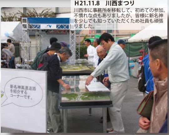
H21.11.8 川西まつり 川西市に事務所を移転して、初めての参加。不慣れな点もありましたが、皆様に新名神を少しでも知っていただくため社員も頑張りました。