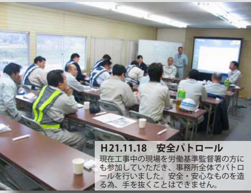
H21.11.18 安全パトロール 現在工事中の現場を労働基準監督署の方にも参加していただき、事務所全体でパトロールを行いました。安全・安心なものを造る為、手を抜くことはできません。