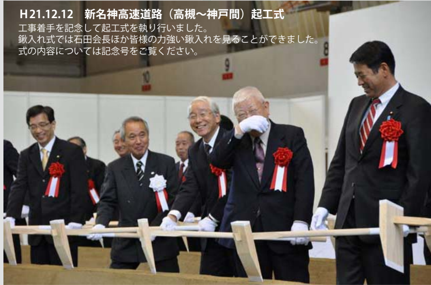
H21.12.12 新名神高速道路 (高槻～神戸間) 起工式 工事着手を記念して起工式を執り行いました。鉄入れ式では石田会長ほか皆様の力強い鉄入れを見ることができました。式の内容については記念号をご覧ください。