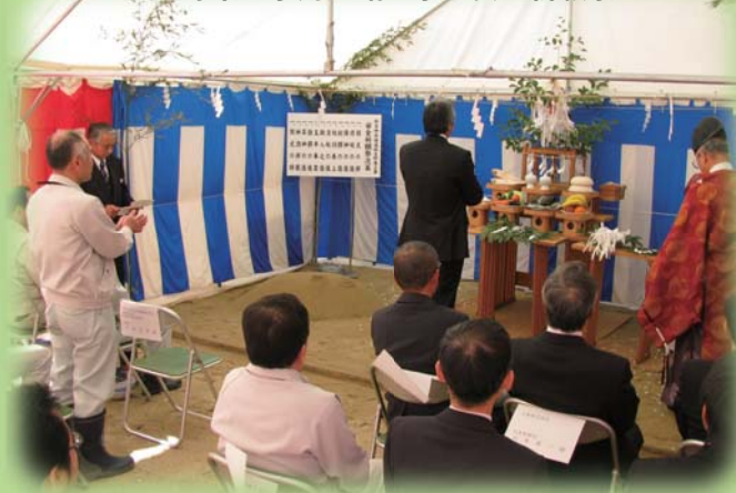
H21.3.12 生野東工用道路工事 安全祈願祭

晴天にめぐまれ、参加者全員で無事故・無災害での工事完了への思いを一つにしました。