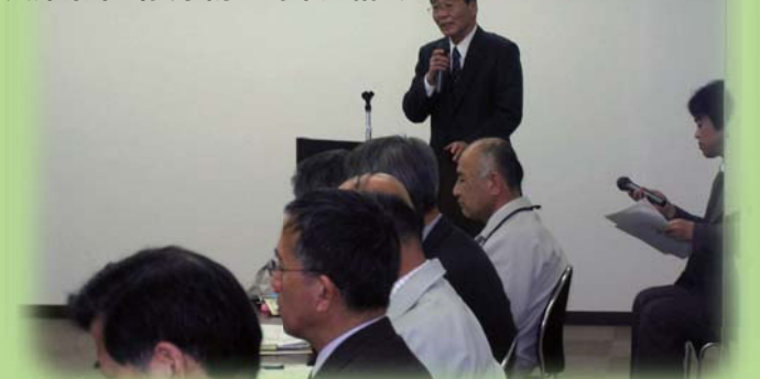
H21.2.26 兵庫県不当要求防止対策連絡会

不当要求行為に対して、兵庫県警本部とより一層の連携を強化し対処していくことを確認しました。