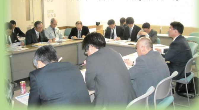
H21.3.25 新名神高速道路事業連絡調整会議 [川西市域]

新名神高速道路及び県道川西インター線建設事業における現在の進捗状況や課題について、兵庫県・川西市と確認を行いました。今後は、課題に対する対応策など、早期開通に向けて相互に調整を図っていきます。