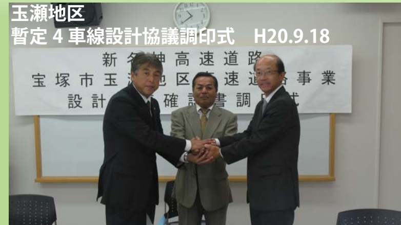
玉瀬地区 暫定4車線設計協議調印式 H20.9.18