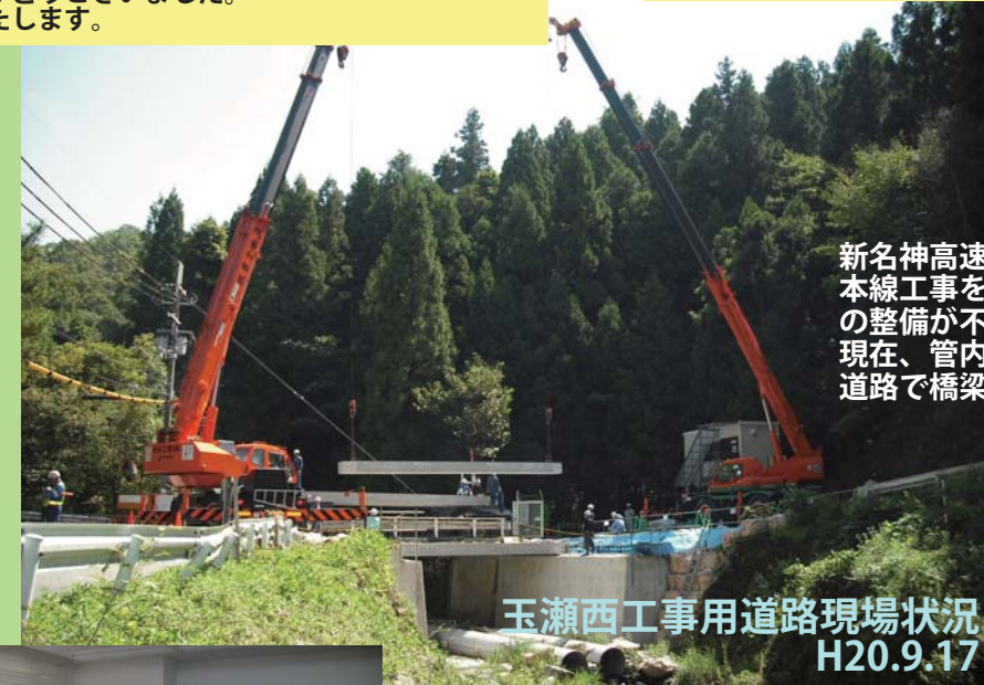
玉瀬西工事用道路現場状況 H20.9.17

来年1月事務所移転に向け、9月1日から川西市の新事務所予定地にて建築工事現地着手。現在は基礎工事中。