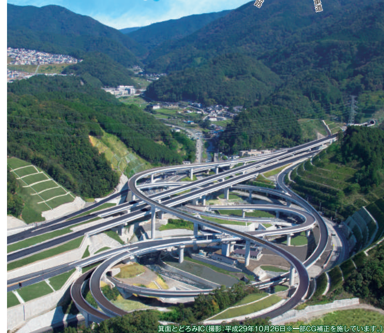
箕面とどろみIC(撮影:平成29年10月26日※一部CG補正を施しています。)