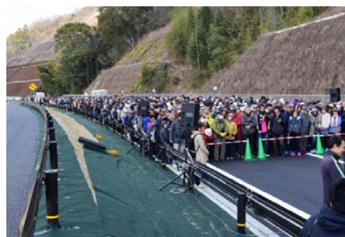
ウォーキングイベント開催状況

和歌山JCT開通に伴って、和歌山市と岩出市の各都市が主催の開通プレイベント（ウォーキング）が開催されました。それぞれ5000人もの参加（主催者発表）をいただき、期待の大きさを実感しました。