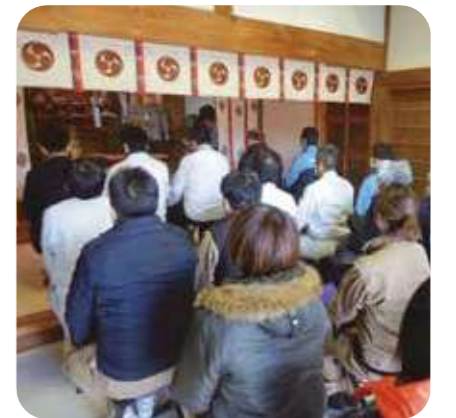
安全祈願祭 樋谷・諏訪神社(神戸市西区)にて菅野地区上部工架設の工事安全祈願祭を実施しました。