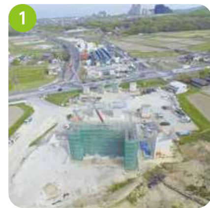
菅野地区状況 県道小部明石線、樋谷川にかかる橋を作っています。橋台、橋脚は概ね完成しました。これから橋桁を順次架設していきます。