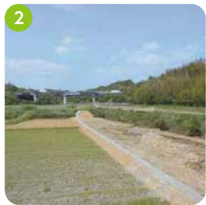
松陰地区状況 石ヶ谷JCT～明石SA間の付加車線に必要な工事用道路の工事に着手しました。