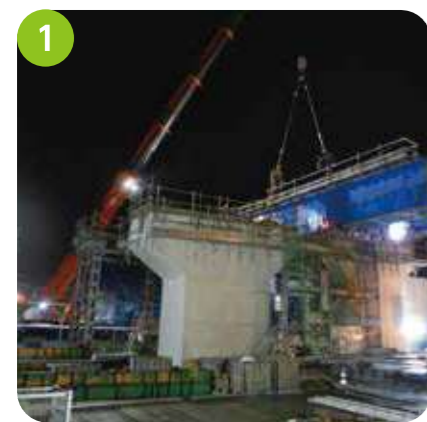
橋桁架設の様子 令和4年4月上旬～下旬にかけて、県道小部明石線にかかる橋桁を架設しました。250t吊のクレーンを県道に配置し、夜間に架設しました。