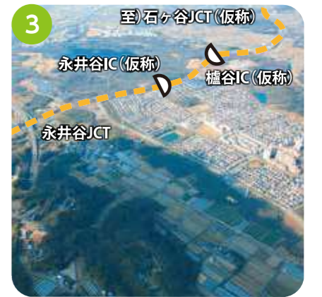
永井谷JCT～樋谷IC(仮称) 土工事を契約しました。今後、工事に着手していく予定です。